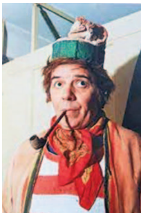
Sl. 19. Tonino Micheluzzi (1923–1991), photo: FITA Venezia , 2017.

Od ranih 1980-ih vratio se u Veneciju radeći s glumcima amaterima, prenoseći im svu svoju strast i iskustvo. Preminuo je u Osimu 15. juna 1991. 73 S njim se ugasila glumačka dinastija koja je obuhvatala i lozu Borisi.