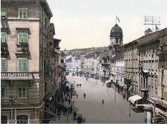
Sl. 3. Rijeka, Korzo, krajem XIX v. 30

„Ustrajna cirkulacija glumaca, pjevača i družina između Trsta i Rijeke tokom ratnih godina pokazatelj je bliskih političko-kulturnih veza između dviju lučkih stvarnosti dvojne monarhije. Isti nazivi teataru otkrivaju zajedničku sudbinu dvaju gradova: u oba je bio teatar Fenice (privatni) i opštinsko pozorište nazvano po Giuseppeu Verdiju.