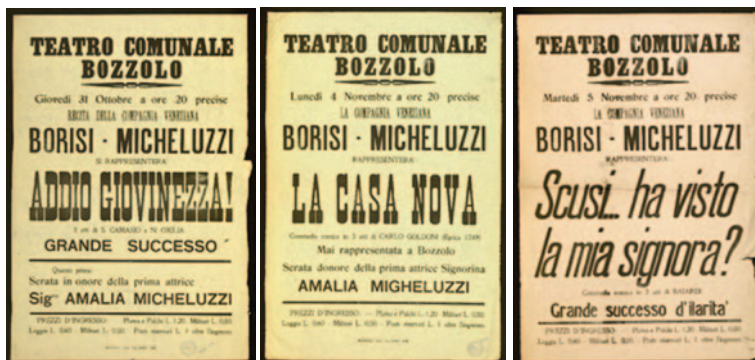
Sl. 5–7. Teatro comunale Bozzolo: venecijanska trupa Borisi-Micheluzzi

predstavljani su planirani nastupi družine Borisi-Micheluzzi u mantovanskom teatru Bozzolo: