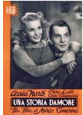
Sl. 14. Una storia d'amore , film iz 1942. g. 63