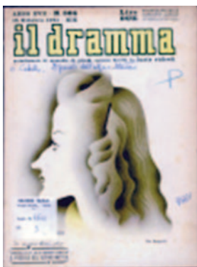
Sl. 10. Il dramma (naslovnica), quindecimale di commedie, Anno XVII – N. 364, Torino, 15 ottobre 1941 – XIX.